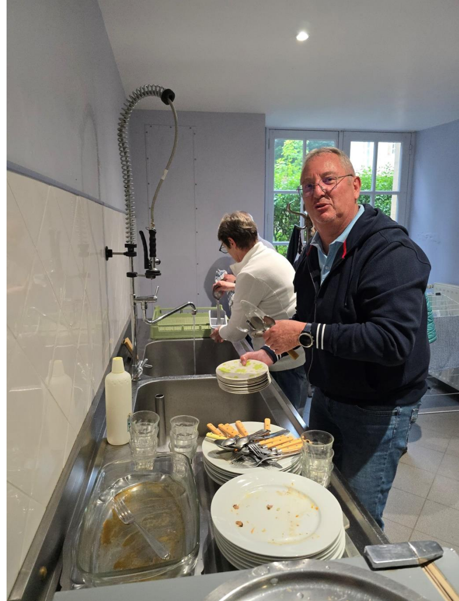
Bayeux 2024 - Tous à la plonge, on n'est pas au Ritz