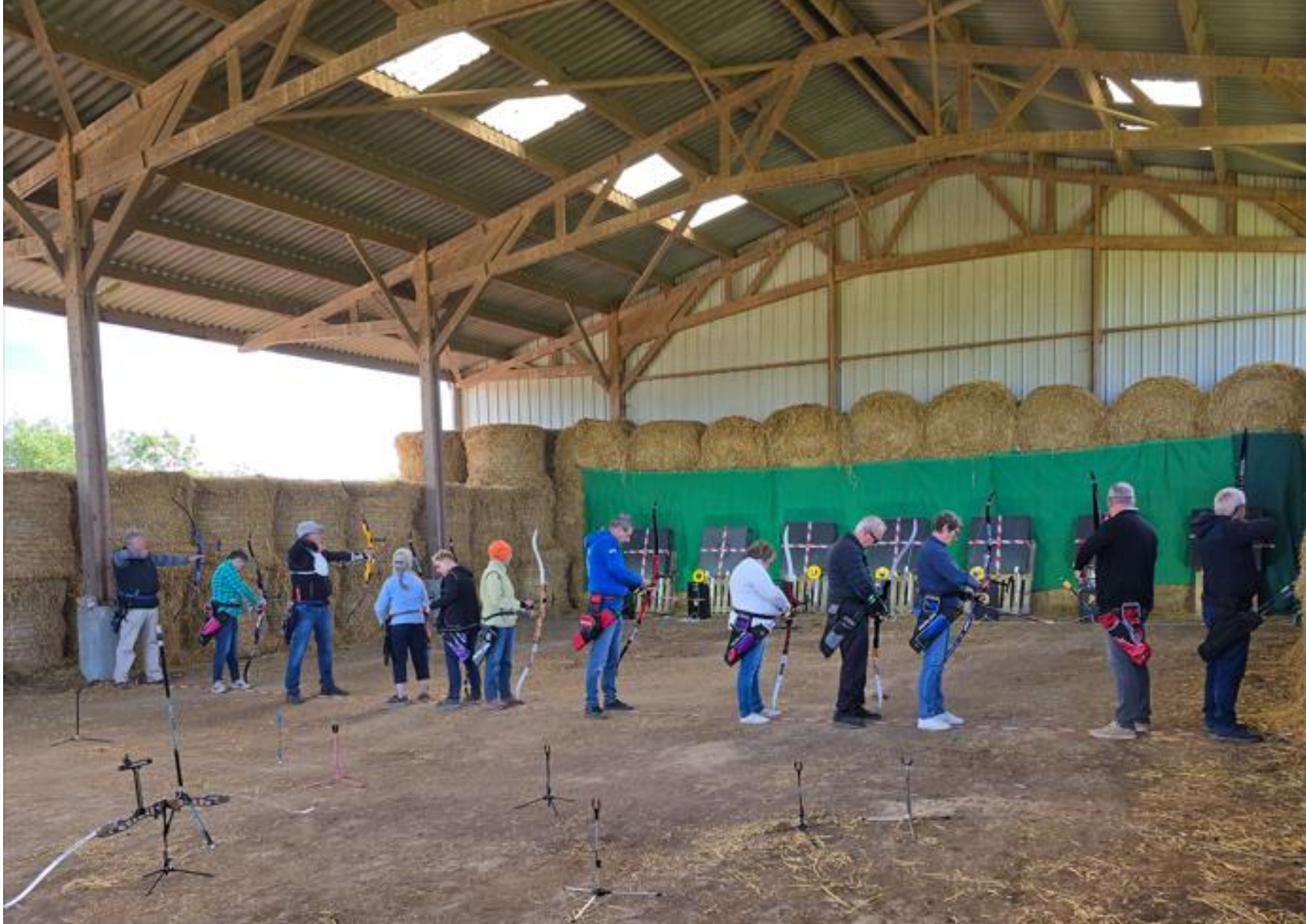
Bayeux 2024 - Le pas de tir à la ferme