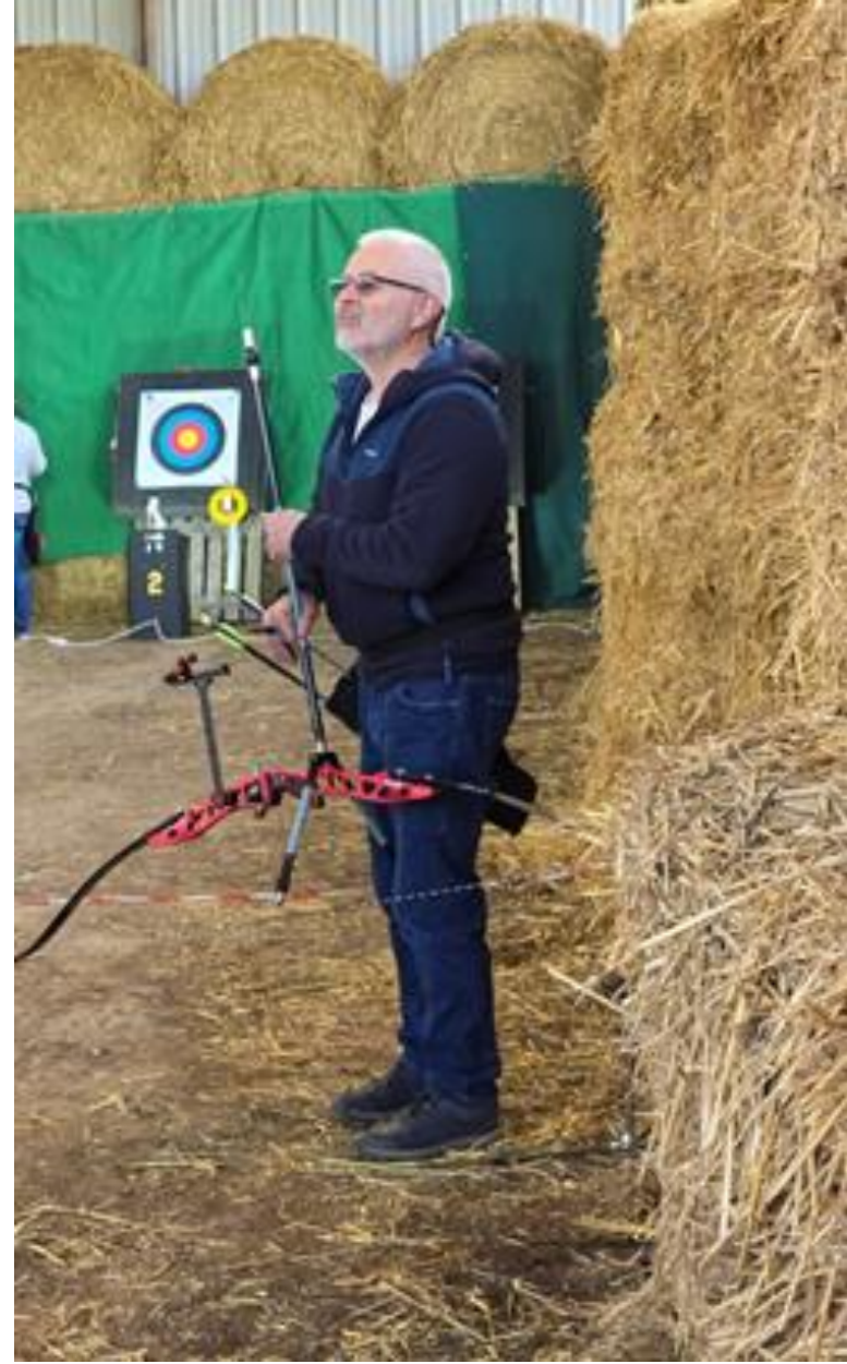
Bayeux 2024 - Une explication sur le résultat