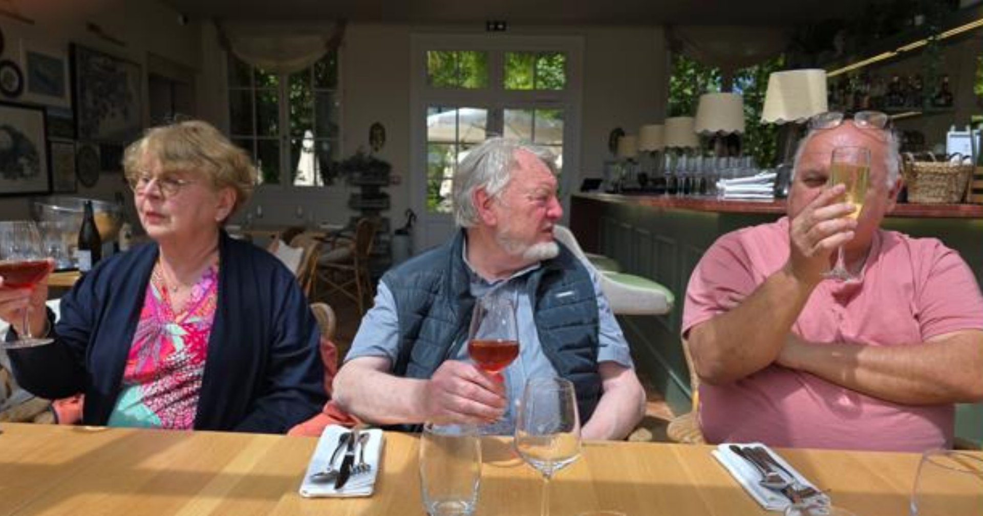
Bayeux 2024 - Ils trinquent à un prochain séjour