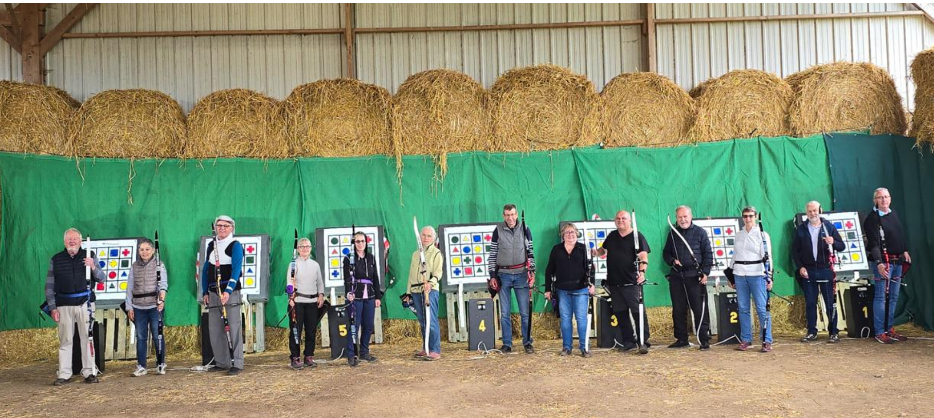
Bayeux 2024 - L'escadron d'archers en campagne