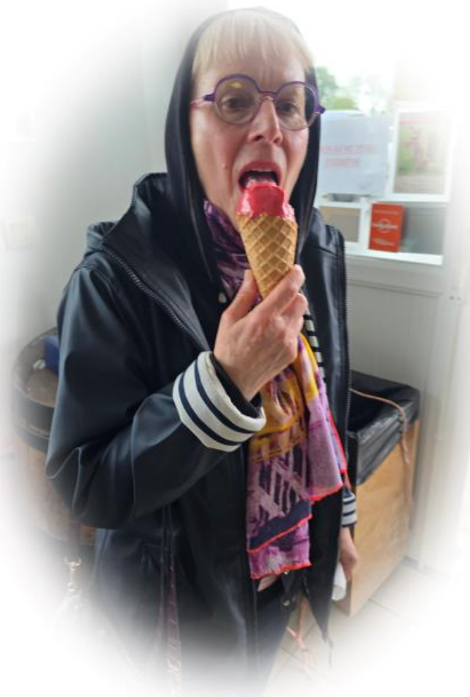
Bayeux 2024 - Un passage apprécié chez un glacier