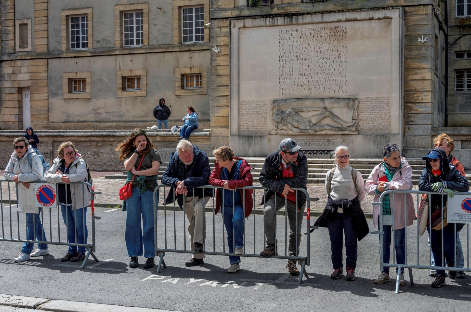
Bayeux 2024 - Délégation : ils n'ont pas pris de tickets de stationnement